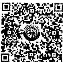
QR CODE สิ่งที่มาด้วย

กองส่งเสริมและพัฒนากิจการการศึกษาท้องถิ่น กลุ่มงานส่งเสริมการจัดการศึกษาท้องถิ่น โทร. ๐-๒๒๕๑-๙๐๐๐ ต่อ ๕๓๑๒ โทรสาร ๐-๒๒๕๑-๙๐๒๑-๓ ต่อ ๒๑๘